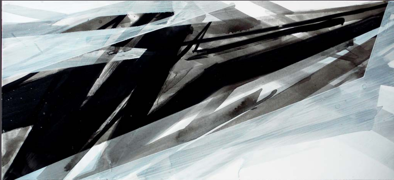
▲ Negative 002