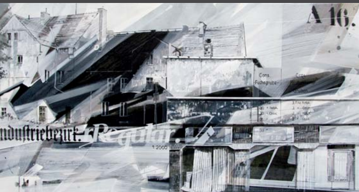
▲ rRegular 2000