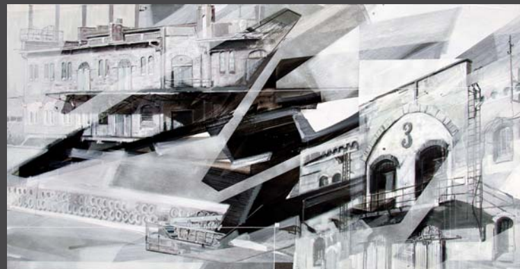
▲ rRegular 001 KRNK Rave Otox