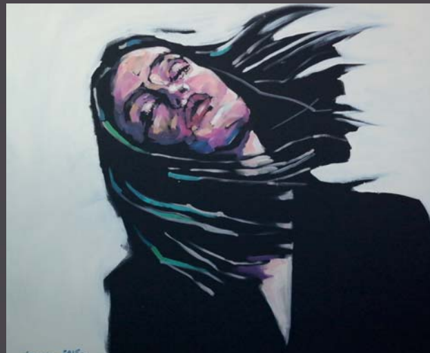
▲ Stronger than me