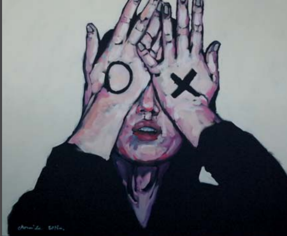
▲ Kółko i krzyżyk