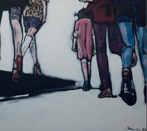
▲ Follow me